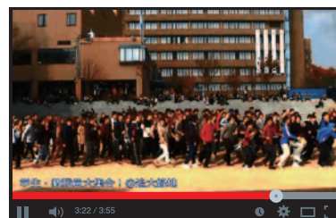
フォーチュンクッキー 追大

AKB48の楽曲「恋するフォーチュンクッキー」に合わせて、学生教職員のべ500名が撮影に参加したムービー「恋するフォーチュンクッキー 追手門学院大学 Ver.」