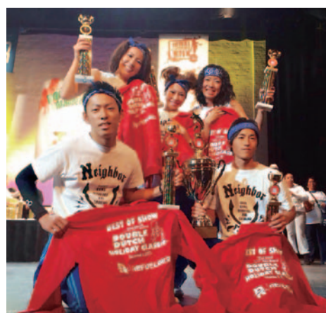
ダブルダッチ世界大会優勝!

において、追手門学院大学在学生在で構成されたチーム「Neighbor Hood (ネイバーフッド)」が優勝した。