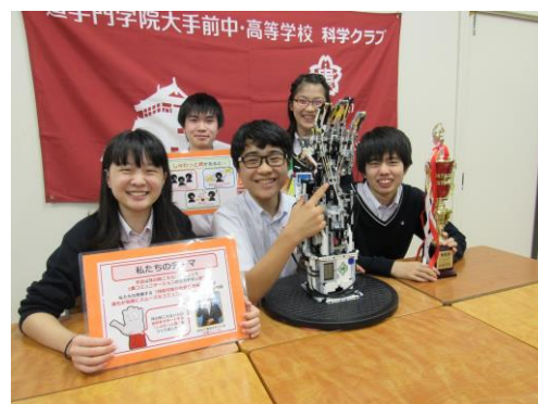
手話ロボットで世界3位に入賞した 中学生チーム（2017年撮影）